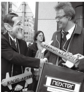
Aksjonsdag i Brussel 2009 ved den belgiske organisasjonen mot uranvåpen.

Vi har få ansatte og en viktig del av arbeidet gjøres av ubetalte frivillige fra hele verden. Vår lobbyvirksomhet er betalt av små private gaver fra medlemmer. Støtt dette viktige arbeid med en gave til ICBUW.