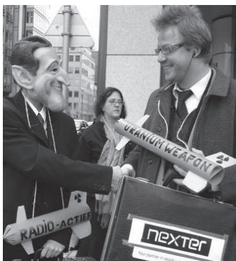
Actividad para el Día de Acción 2009 en Bruselas, por la Coalición belga Fin a las Armas con Uranio.

Para ayudar a apoyar este importante trabajo por favor consideren hacer un donativo a ICBUW.